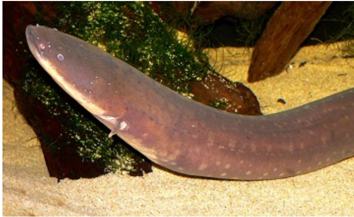
« anguille électrique »

on ne peut pas utiliser directement l'énergie électrique qui serait présente dans la nature