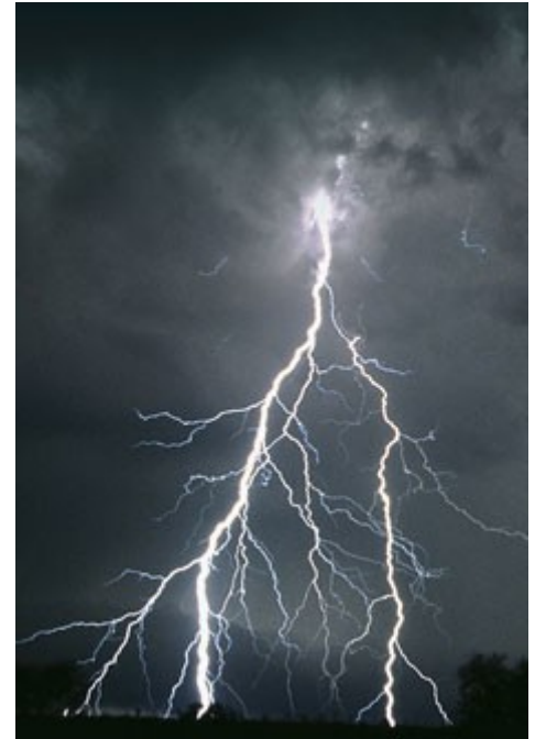
« foudre »